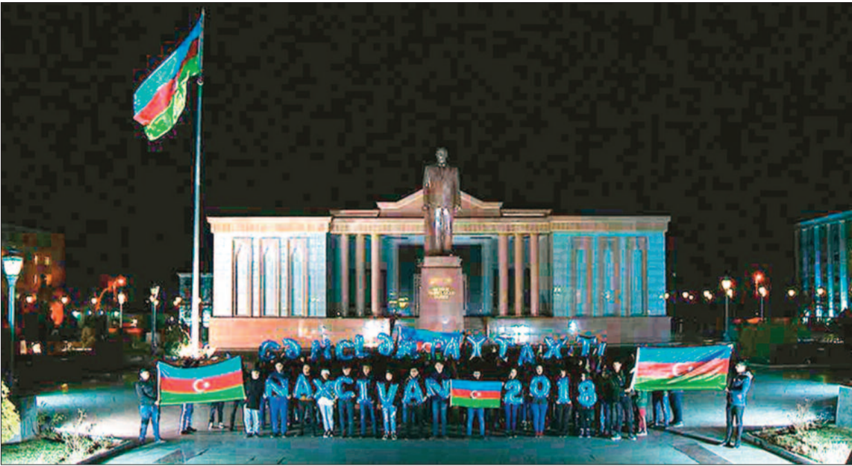
“Gənclər Paytaxtı”nın gəncləri